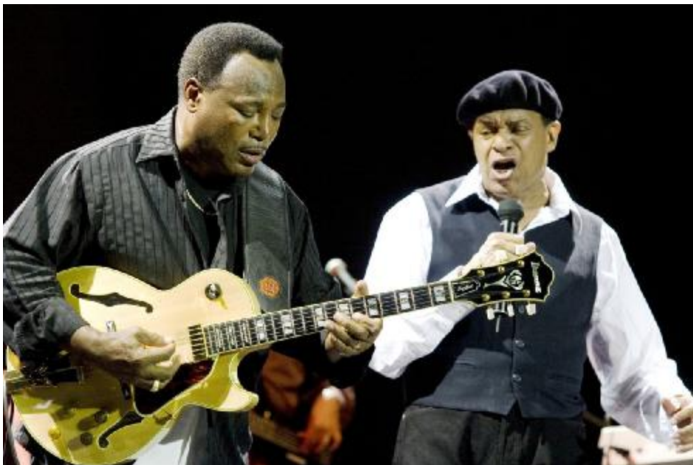
George Benson y Al Jarreau en Jazz San Javier (2007)

En la edición de 2015, el apoyo de los medios de prensa escrita, televisiones y radios se mantuvo con todo su potencial un año más, con emisión de once conciertos en La 2 de TVE; Radio Nacional de España realizó un programa especial de dos horas de duración la noche del sábado 29 de agosto, y la 7 Televisión de Murcia emitió todos los conciertos en las noches de los sábados durante los meses de agosto y septiembre.