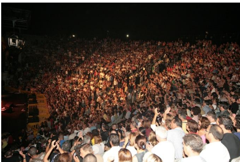
Vista del Parque Almansa durante un concierto

Baste decir, como dato, que el Festival de Jazz de San Javier cerró en la quinta edición, como noticia cultural más relevante, cinco telediarios , dos de la primera cadena, dos de La 2 y uno de Tele 5.