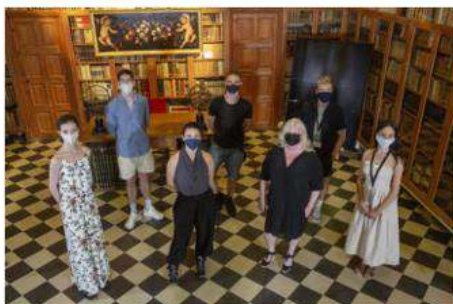
El Festival de Peralada (Girona) homenajea a Carmen Mateu en la gala 'Ballet under the stars'.

El Festival Castell de Peralada (Girona) rinde homenaje a la promotora cultural Carmen Mateu, fundadora del festival y fallecida en 2018, en la gala 'Ballet under the stars', que se celebrará este viernes.