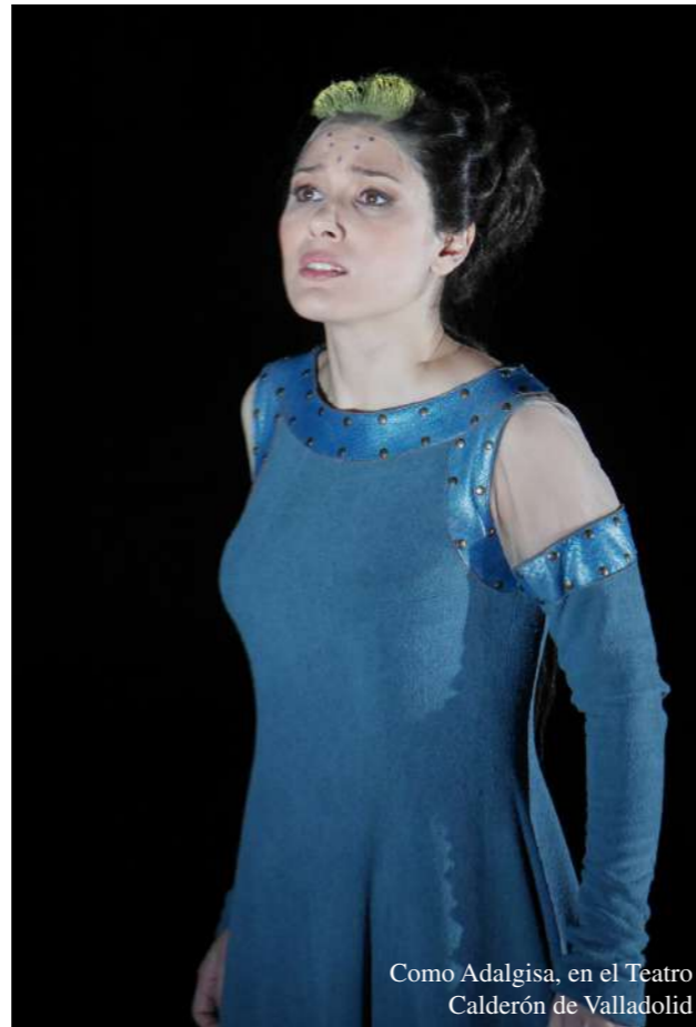
Como Adalgisa, en el Teatro Calderón de Valladolid

Ha sido Rosina de Il Barbiere di Siviglia en Roma, Verona, Berlín, Dresde, Bilbao, Barcelona, Lausanne, Tel-Aviv y Montecarlo y ha interpretado a Suzuki en la prestigiosa inauguración de la temporada 2016/2017 del Teatro alla Scala de Milán con Madama Butterfly ; al