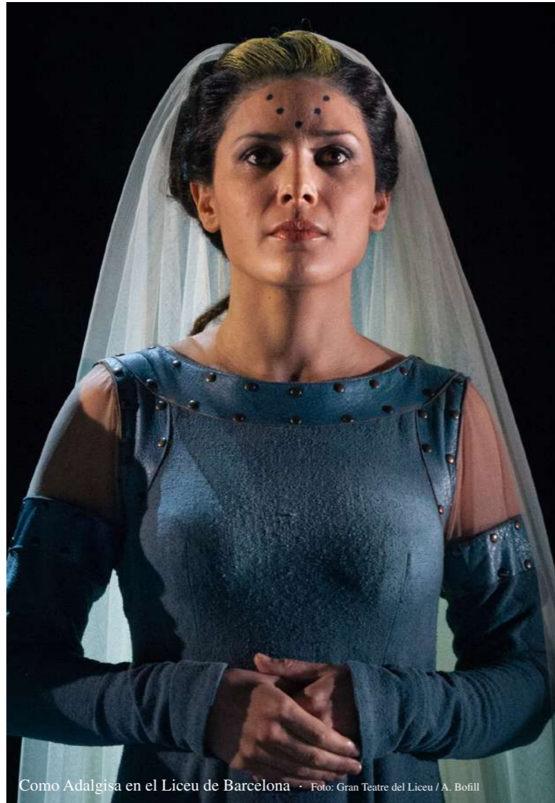
Como Adalgisa en el Liceu de Barcelona ·