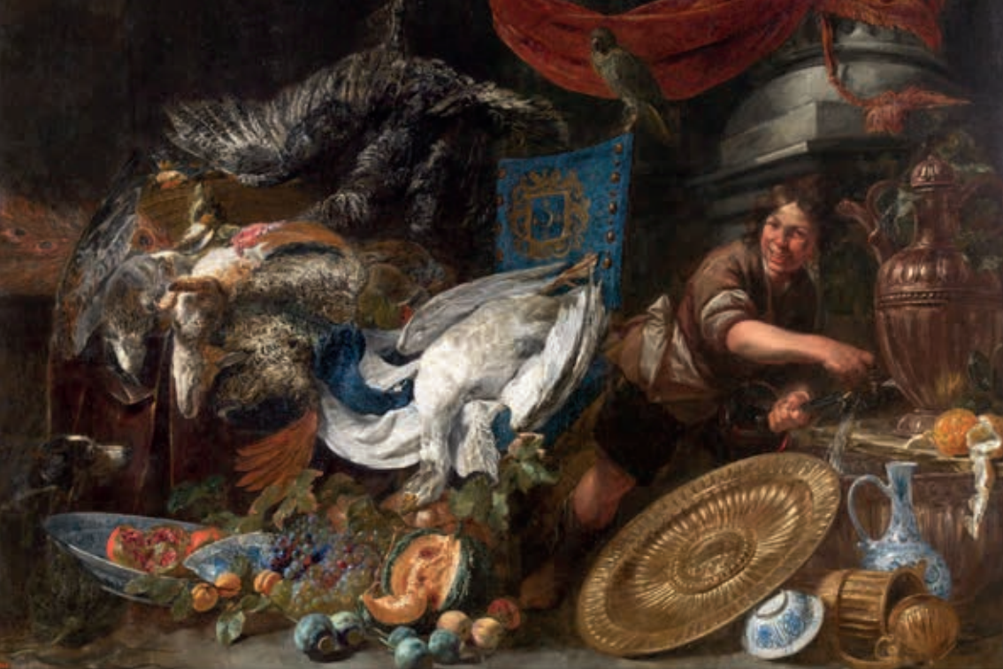
Granadas en el Museo del Prado. Peeter Boel, Despensa (s. XVII) - Óleo sobre lienzo, 172 x 252 cm © Museo del Prado